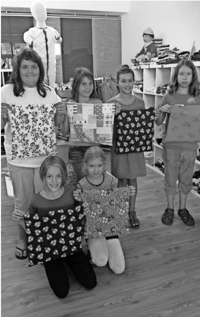
Bilder und Texte Georg Leonhart

Am 18.08.2015 trafen sich alle die sich für das Projekt Kissen nähen angemeldet hatten in dem Laden von Marion Werle und suchten sich einen Stoff aus. Danach ging es richtig los. Es konnten immer drei Kinder gleichzeitig an drei Nähmaschinen arbeiten an der vierten konnte man sich eine der zwei Seiten die genäht werden mussten in Sekundenschnelle nähen lassen. Die Maschine hatte an der Nadel ein Messer, mit dem sie überstehenden Stoff gleich abschnitt. Den Rest mussten wir allerdings selber machen. Aber die Mühe hatte sich gelohnt denn am Ende des zweistündigen Kurses konnten Mädchen wie Jungen ihre schönen Kissenbezüge mit nach Hause nehmen.