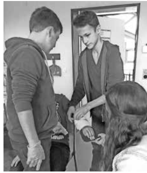
Hier wird eine Armschiene zur Erstversorgung angelegt

Freizeit an einem Freitag von 14 Uhr bis 18 Uhr und an einem Samstag von 9 Uhr bis 16 Uhr! Lehrer Dominic Weeber-Hafzovic , der die Schulsanitäter-Arbeitsgemeinschaft an der WAL-Schule mit großem Erfolg leitet, war voll des Lobes über das Engagement der neuen wie der „alten“ Schulsanitäterinnen und Schulsanitäter.